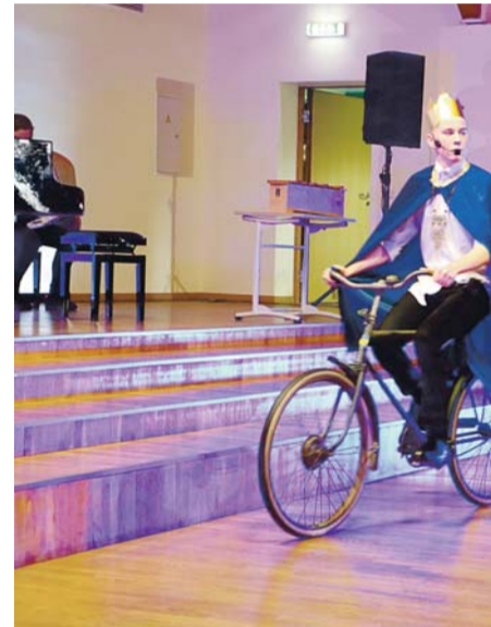
Noored tegid etenduse.