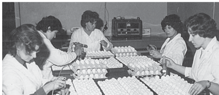
Naised valgustasid haudejaama saabunud munad lampidega läbi, et kontrollida koorekvaliteeti (1975).

Leningradi oblastist toodi 1956. aastal Tallinna Linnuvabrikusse esimesed noorkanad, kelle munad 1957. aastal Loo haudejaamas haudadesse pandi. Hiljem toodi lisaks Tallinna Linnuvabriku sugulindlatetele (kanalad, kus peeti koos kukki ja kanu) haudejaama mune ka kolhooside-sovhooside linnufarmidest.