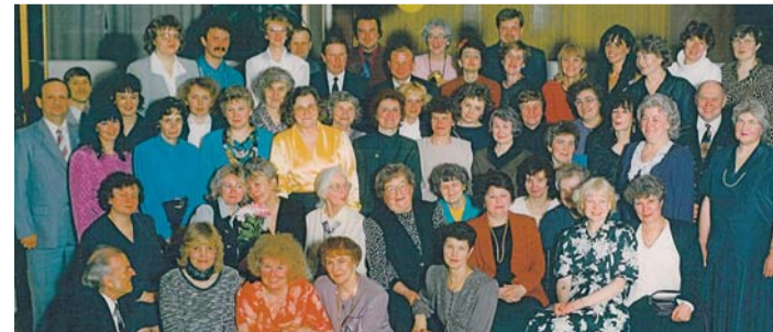
Haudejaama 40. sünnipäeva tähistas töökollektiiv Linnuvabriku sööklaas (1997).

Algul vedasid haudejaama autojuhid tibusid Eesti ja Venemaa linnukasvatustamanditesse vene furgoonautodega. Need olid kohandatud tibude vedamiseks sellisel, et kongis püsis õige temperatuur ja õhk vahetus. Hiljem osteti spetsiaalselt tibude vedamiseks mõeldud Mercedes-Benz'i veoautod. Tibusid saatsime tugevast papist karpidega ka välismaale, näiteks transportlennukitega Aserbaidžaan, Usbekki ja Gruusiassa. Töö oli küllaltki pingeline. Haudejaam töötas ööpäevaringselt, tingimused hautamiseks ja koorumiseks pidid olema täpselt paigas ning töö oli füüsiliselt raske. Kõiki tibukaste (puust) ning haude- ja koorumisreste tuli naisel ise palju ja küllaltki kõrgele tõsta.