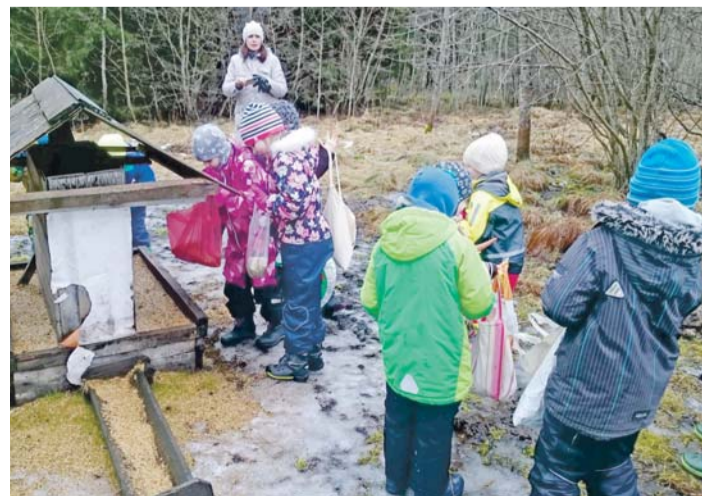
Kostivere lapsed ulukitele süüa viimas.

Kui koerad ära silitatud ja kallistatud, oli selleks korras metsaüritus läbi.