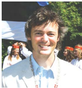
Art Kuum vallavolikogu esimees

OECD on oma iga-aastastes raportites mitmeid kordi rõhutanud, et avalikud teenused on omavalitsuste suure arvu tõttu Eestis liialt kallustunud ja vajaksid tsentraliseerimist. Seda probleemi haldusreformiga lahendada püütud ongi. Kui nüüd aga maavalitsuste osa funktsioonide omavalitsustele üle antakse, oleks lõpptulemus ilmselt vastupidine sellele, mis algul eesmärgiks seati. Loodan, et vabariigi valitsus siin vanarahva tarkust kuulda võtab ja ikka seitse korda mõeldab enne kui lõikama asub.