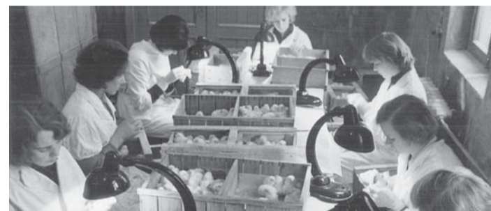
Tibude sugupoolte määramine oli viimane töö, mis tibudega haudejaamas tehti enne, kui nad kastidesse pakiti ja lindlatesse saadeti.

20. päeval viidi munad koorumiskappi. Kahe päeva jooksul arenesid seal lõplikult välja ja koorusid tibud. Koorumiskapid olid suuremad kui haudekapid. Munad laoti metallrestidele küllili ning hõredamalt, et tibu oleks ruumi kooruda. Koorumiskapi režiim erines haudekapi omast: munad vajasid rohkem niiskust, intensiivsemat õhuvahetust ning veidi madalamat temperatuuri (u 37 kraadi). Kuigi kõike reguleeris automaatselt kapp ise, käis valveoperaator ka seal iga paari tunni tagant näite kontrollimas. Koorus kuni 90% haudesse pandud munadest. Aastas hautasime Lool 7–8 miljonit tibu. Meist sai linnuvabriku üks suuremaid osakondi, kui 1983. aastal liideti Loo haudejaamaga Haapsalu haudejaam, töötajaid oli siis umbes 65.