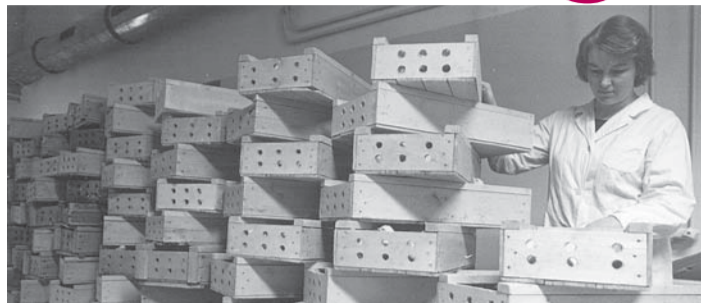
Tibudega täidetud puidust kastid laoti autodesse laadimise eel virmadesse. Iga kasti põhja pandi allapanuks peotäis puitvilla. Ühte kasti mahtus 50 tibu. Fotol Pilvi (Pille) Siimisker (1975).