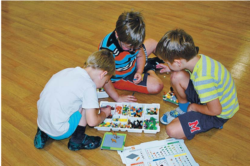
Väikesed robotikud Päikesepesas.

Lego vahendite abil saavad toetatud kõik peamised valdkonnad lapse arengus: mänguoskused, sotsiaalsed ja enesekohased oskused, tunnetus- ja õpioskused, keel ja kõne, matemaatika, kunst ja füüsilise või-